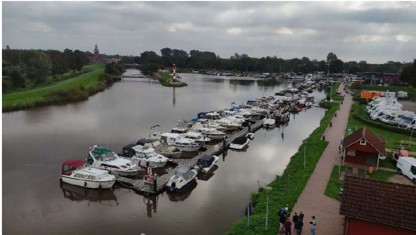
Soeste-Ticker Barßeler Ruderverein 2024

Und ich (Conny) bin mir ganz sicher: Ich werde wieder kommen zum Matjesrudern in Barßel! Und ich werde beim nächsten Mal kräftig die Werbetrommel rühren, denn diese tolle Veranstaltung sollten vielmehr Sehnder besuchen.