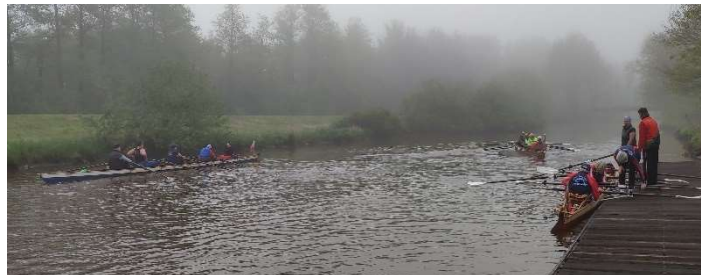
Soeste-Ticker Barßeler Ruderverein 2024