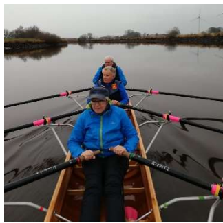
Soeste-Ticker Barßeler Ruderverein 2024