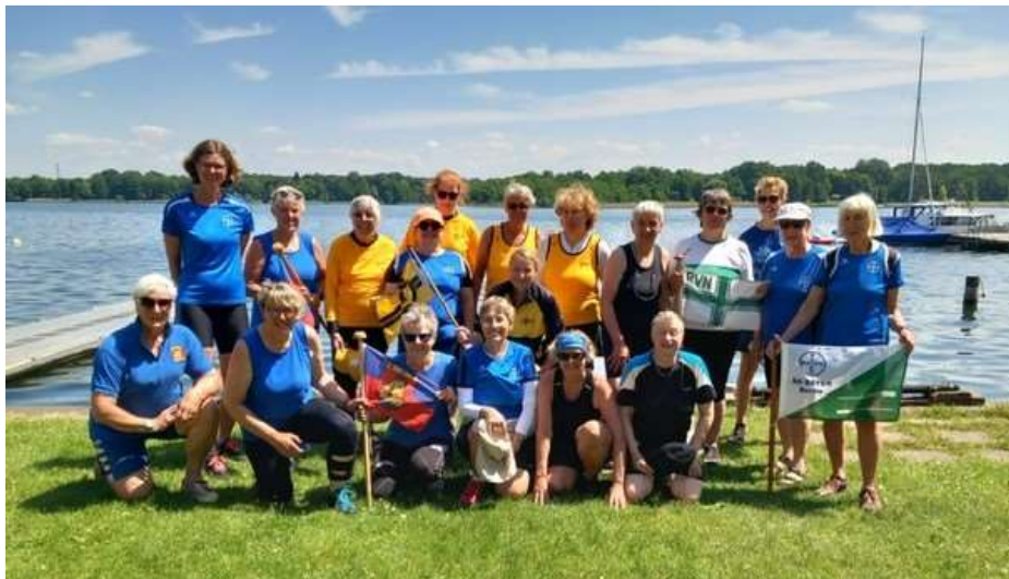
Soeste-Ticker Barßeler Ruderverein 2024