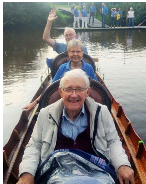
Probefahrt zum Hafen